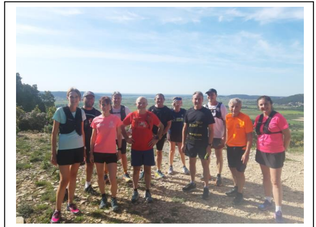
Sorties de samedi matin. Manque le groupe de trail

Les certificats medicaux seront toujours valables jusqu'au 31Aout 2024 au delà seul le pps sera accepté.