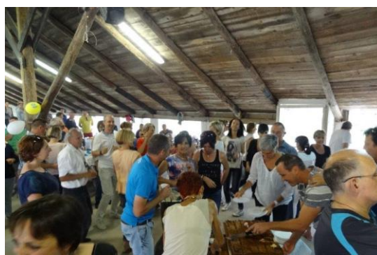
Les 10 ANS des BIPEDES 2016 Voir paragraphe spécial dans la lettre