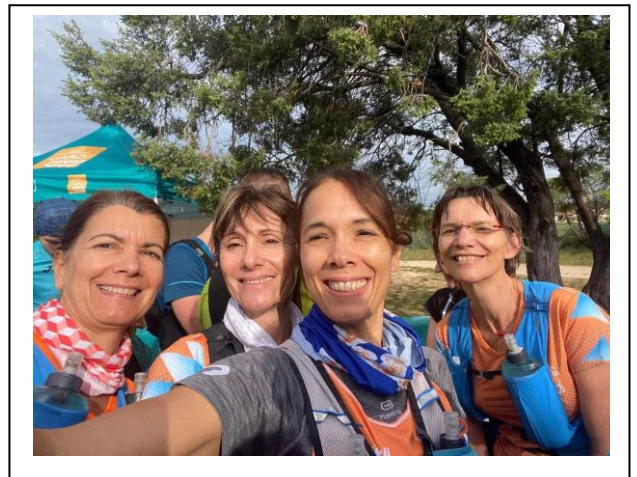
Le sourire de nos féminines avant le départ

Journée BIPEDES du samedi 25 MAI 2024 Les inscriptions peuvent encore être prises jusqu'au 15 MAI